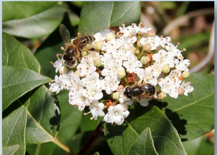
Ape e sirfide su viburno laurotino

Per ulteriori informazioni è possibile contattare i tecnici del C.A.A. "Giorgio Nicoli" S.r.l. (051/6802227) rferrari@caa.it