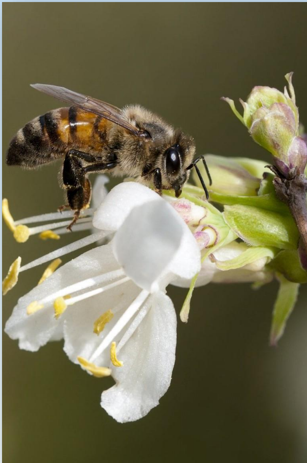
Ape su caprifoglio invernale