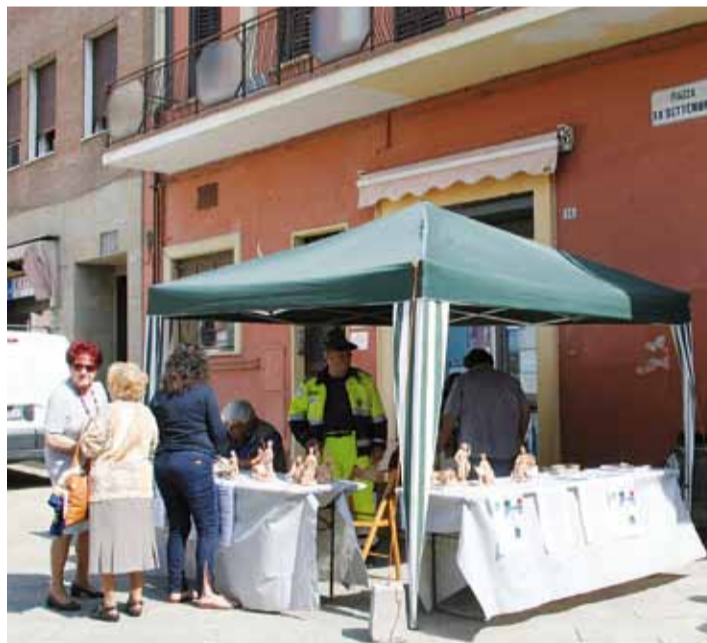
Il Gruppo Alpini, in collaborazione con associazioni e cittadini, ha organizzato varie iniziative per la raccolta di fondi pro terremotati di San Felice sul Panaro, dedicando anche volontari per la gestione della cucina del campo di Casumaro