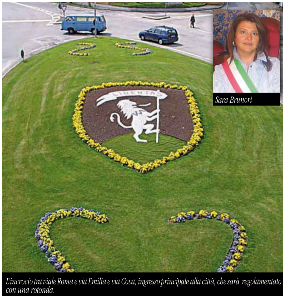
L'incrocio tra viale Roma e via Emilia e via Cova, ingresso principale alla città, che sarà regolamentato con una rotonda.

Rotonda via Torricelli - via Emilia Altro intervento per razionalizzare il traffico sulla via Emilia