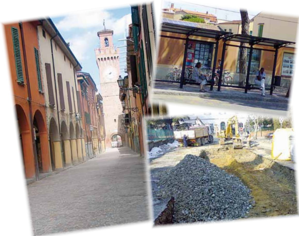
Alcuni degli interventi eseguiti negli ultimi mesi

Nel 2011 la raccolta differenziata di rifiuti a Castel San Pietro Terme è aumentata di oltre due punti percentuali, attestandosi al 46%, a fronte di una media nazionale di circa il 33% (Rapporto rifiuti Ispra). La quantità complessiva di rifiuti urbani gestita nel 2011 è stata di circa 14.400 tonnellate, sostanzialmente stabile rispetto all'anno precedente, pari a 694 kg di rifiuti procapite, di cui 324 kg raccolti in modo differenziato.