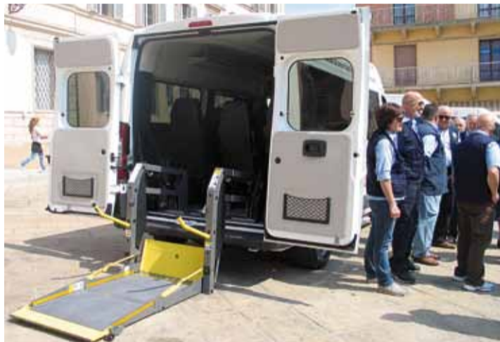
L'automezzo è attrezzato anche con la pedana per sollevare le carrozzine

Per usufruire del servizio occorre contattare lo Sportello Cittadino del Comune tel. 051/6954154 dal lunedì al sabato dalle ore 8 alle ore 13 ed il giovedì pomeriggio dalle ore 15 alle ore 18.