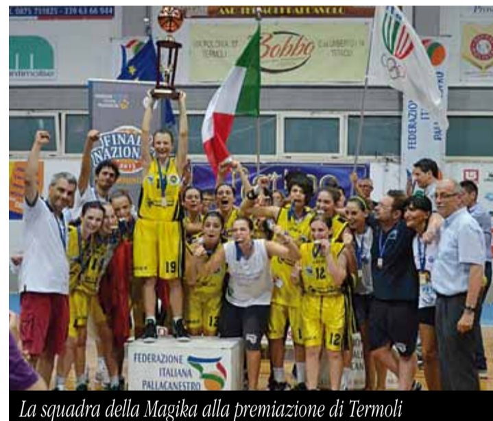
La squadra della Magika alla premiazione di Termoli