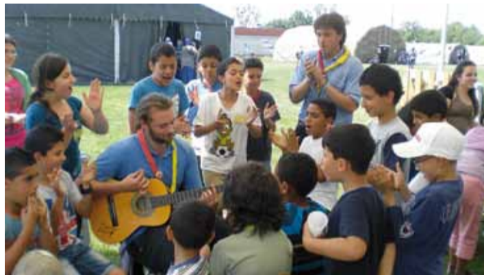
Gli Scout di Castel San Pietro Terme hanno prestato servizio a Crevalcore per assistenza alla popolazione e animazione dei bambini