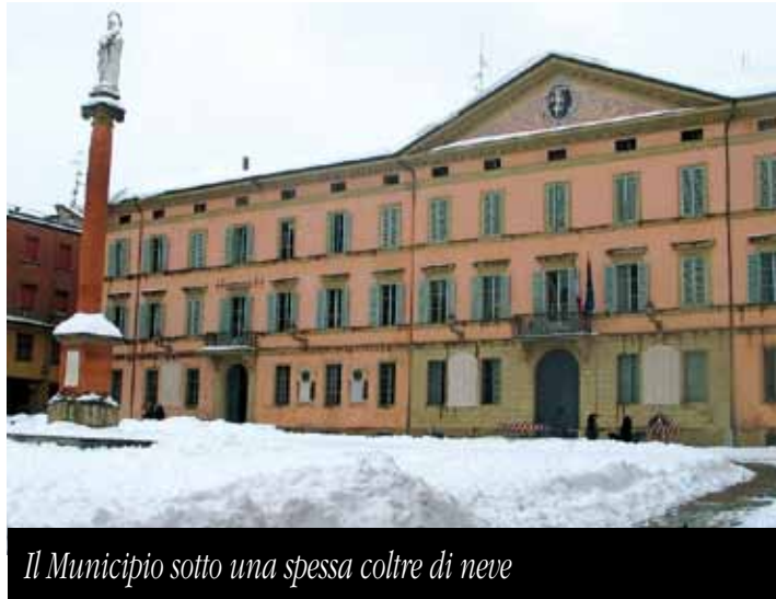
Il Municipio sotto una spessa coltre di neve

- alla Polizia Municipale 800.88.73.98 (tutti i giorni feriali dalle ore 8 alle ore 12,30 e dalle ore 14,30 alle ore 18,30)