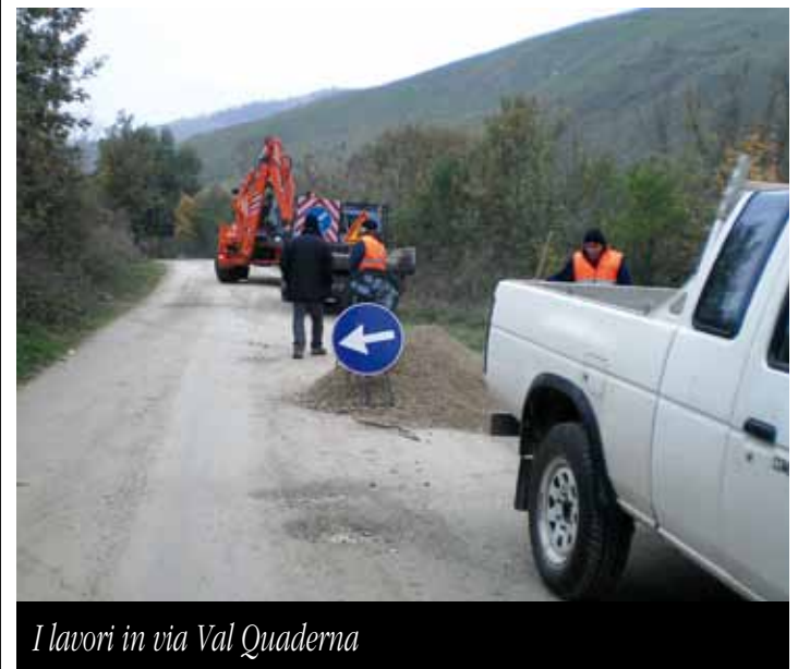
I lavori in via Val Quaderna

Intanto continuano i lavori nei cantieri predisposti dalla Bonifica Renana per la sistemazione di tre frane presenti da tempo sulle strade comunali: due in via Tanari ed una via Paniga.