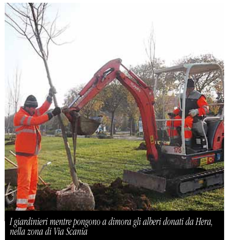
I giardinieri mentre pongono a dimora gli alberi donati da Hera, nella zona di Via Scania

In totale questa iniziativa consentirà di mettere a dimora 2.000 nuovi alberi. Intanto i clienti Hera che, al 31 ottobre, hanno deciso di rinunciare alla bolletta cartacea passando a quella elettronica sono 44.507. Grazie a loro si potranno risparmiare 1.052.145 tonnellate di carta all'anno evitando l'immissione in aria di 20 tonnellate di anidride carbonica.