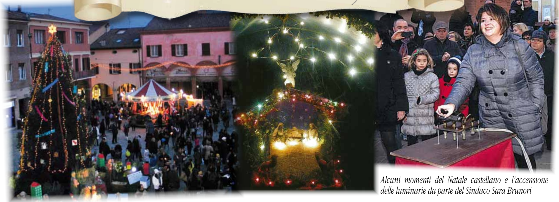
Alcuni momenti del Natale castellano e l'accensione delle luminarie da parte del Sindaco Sara Brunori