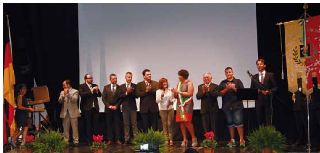
I festeggiamenti per il trentennale del gemellaggio con i Comuni della Croazia