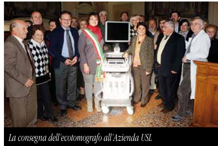
La consegna dell'ecotomografo all'Azienda USL

Nei giorni scorsi è stato donato un ecotomografo multidisciplinare dal Centro Sociale Scardovi alla Casa della Salute di Castel San Pietro Terme.