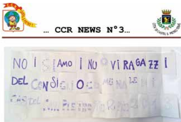
Il giornalino realizzato dal CCR

Proseguono i lavori dei giovani consiglieri del Consiglio Comunale dei Ragazzi, suddivisi nelle tre Commissioni "Ambiente e Sicurezza", "Vivere insieme agli altri, tempo libero e Sport", "Scuola, Cultura-Culture, Spettacolo, Informazioni, Comunicazioni". In questi mesi si stanno confrontando ed elaborando una lista di idee che sono state riportate sul bollettino "CCR News" realizzato dai ragazzi stessi e inviato via mail alle famiglie. Questa importante fase di progettazione dovrà poi concludersi entro la fine dell'anno scolastico 2013-2014, a conclusione dell'esperienza. L'attuale Consiglio Comunale dei Ragazzi è composto da 35 consiglieri (15 ragazze e 20 ragazzi) che rappresentano tutte le classi quarte e quinte delle scuole primarie Sassatelli, Albertazzi, Serotti, Don Milani e