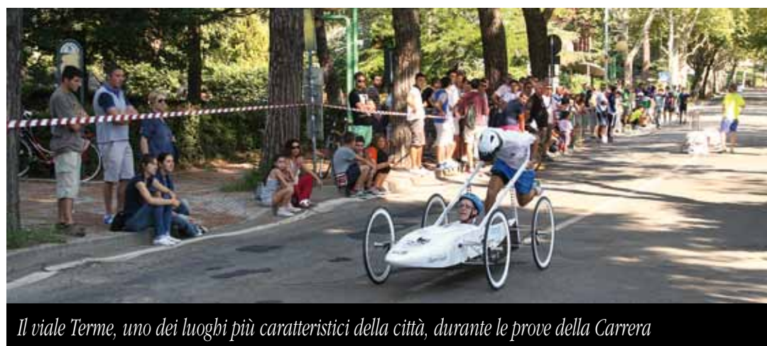
Il viale Terme, uno dei luoghi più caratteristici della città, durante le prove della Carrera