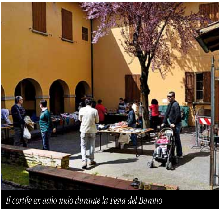
Il cortile ex asilo nido durante la Festa del Baratto

3. una Consensus Conference, nella quale un campione di partecipanti alle precedenti iniziative riprenderà le indicazioni emerse e le approfondirà attraverso un confronto con esperti, tecnici, amministratori comunali, associazioni, per elaborare infine un "Documento di proposta partecipata" che sarà sottoposto al Tavolo di negoziazione e, successivamente, all'Amministrazione comunale.