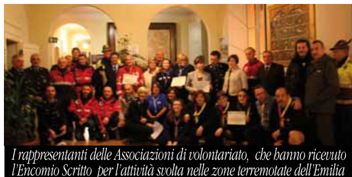
I rappresentanti delle Associazioni di volontariato, che hanno ricevuto l'Encomio Scritto per l'attività svolta nelle zone terremotate dell'Emilia