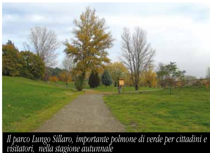
Il parco Lungo Sillaro, importante polmone di verde per cittadini e visitatori, nella stagione autunnale