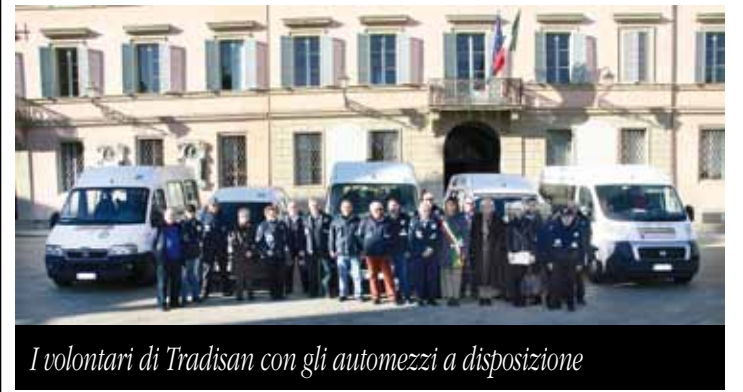
I volontari di Tradisan con gli automezzi a disposizione