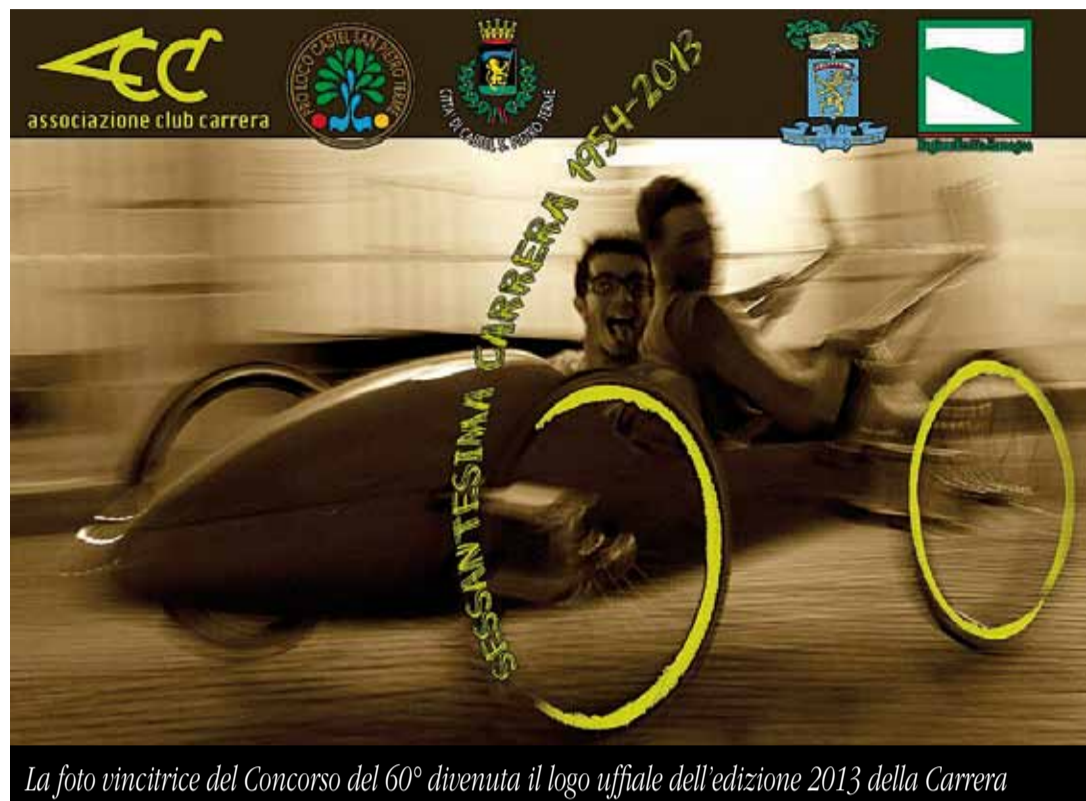
La foto vincitrice del Concorso del 60° divenuta il logo ufficiale dell'edizione 2013 della Carrera