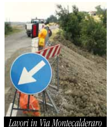
Lavori in Via Montecalderaro