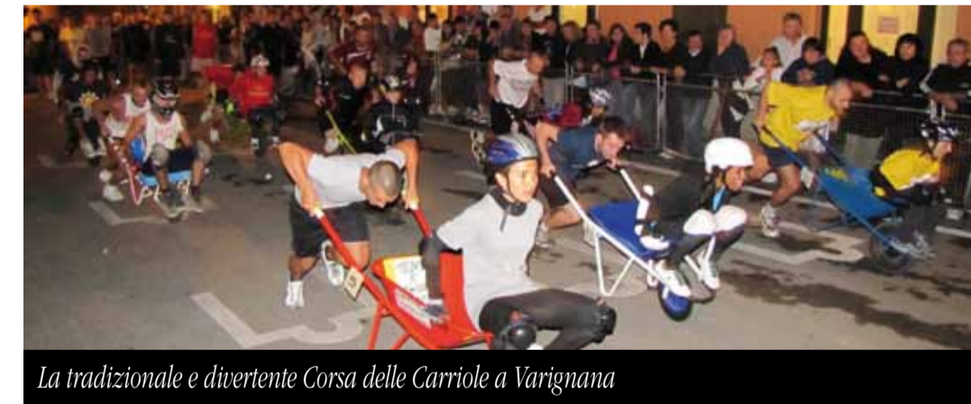
La tradizionale e divertente Corsa delle Carriole a Varignana