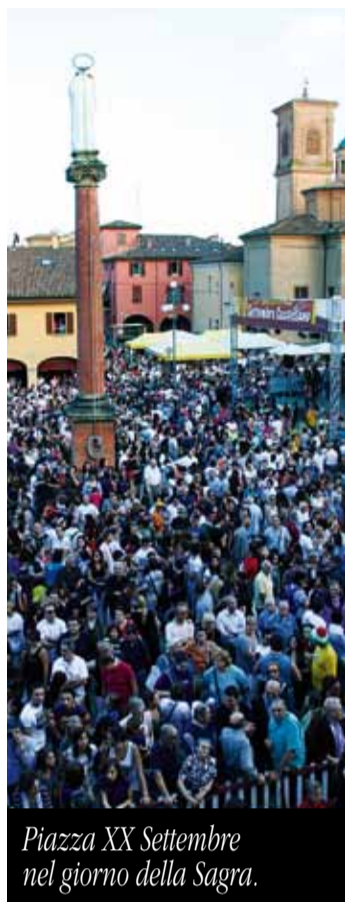
Piazza XX Settembre nel giorno della Sagra.

Il programma del Settembre proseguirà fino alla fine del mese con tanti altri eventi nel centro storico, organizzati grazie alla collaborazione della Pro Loco e di tanti volontari, associazioni e operatori economici, che voglio ringraziare di cuore per il prezioso impegno e l'inesauribile entusiasmo. Fra i collaboratori del "Settembre", ci sarà anche l'attivissimo Gruppo Alpini, impegnato contemporaneamente nei preparativi del 2° Raggruppamento degli Alpini dell'Emilia Romagna e della Lombardia, un altro grande evento che il 19 e 20 ottobre coinvolgerà tutta la città, mentre negli stessi giorni prenderà il via la Festa della Storia. Per il momento buon "Settembre Castellano" a tutti, nella Cittaslow di Castel San Pietro Terme!