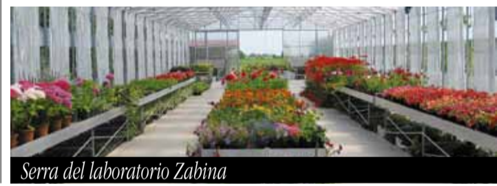
Serra del laboratorio Zabina

Per l'affidamento della gestione il Comune non richiede il pagamento di alcun canone, «in considerazione del valore sociale che l'attività apporta alla comunità locale, in termini di valorizzazione della cultura della solidarietà e dell'integrazione di persone svantaggiate».