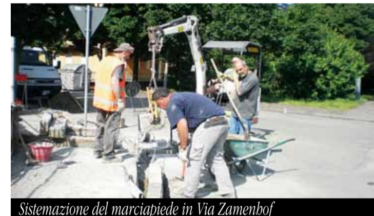
Sistemazione del marciapiede in Via Zamenhof

avevano contribuito al danneggiamento del piano viabile con pericolosi avvallamenti: l'Amministrazione Comunale ha quindi provveduto a ripristinare le condizioni di sicurezza con un intervento del costo di 40mila euro (Iva compresa). Un altro intervento ha riguardato il bagno pubblico posto in viale Terme: come richiesto da tanti cittadini, l'Amministrazione Comunale ha fatto spostare nel parcheggio di via Viara il bagno chimico autopulente. Quel servizio, infatti, era poco utilizzato, a differenza degli altri due che si trovano nel Parco Lungo Sillaro (nel parcheggio della Fonte Fegatella e in quello dell'Ospedale), mentre c'era una forte richiesta per la sua collocazione nel parcheggio di via Viara, particolarmente frequentato in occasione di mercati, fiere, feste nel centro storico, di eventi e iniziative al Giardino degli Angeli, di manifestazioni sportive allo Stadio comunale e anche dai visitatori dell'adiacente Cimitero.