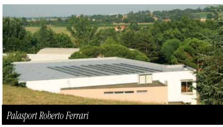
Palasport Roberto Ferrari

a livello ambientale, sfruttando l'energia solare, con un risparmio economico significativo. Nell'occasione, l'Associazione Home, nell'esecuzione dei lavori ha provveduto anche a realizzare le opere necessarie sul tetto per scongiurare le infiltrazioni d'acqua.