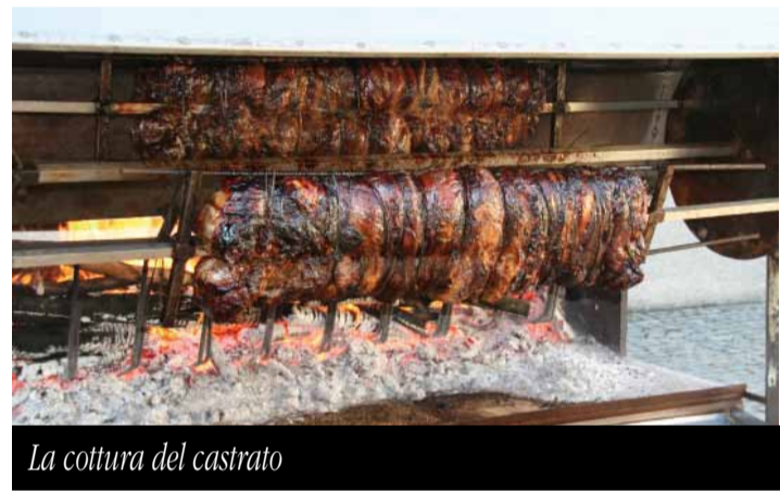
La cottura del castrato